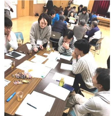
▲磯6クラブの若者も参加

特に印象的だったのは、ワークショップの意見で、最も票を集めたグループの意見が「“地域のために”活動をしない」、「自分たちが楽しい活動を行う」といった目から鱗の内容でした！