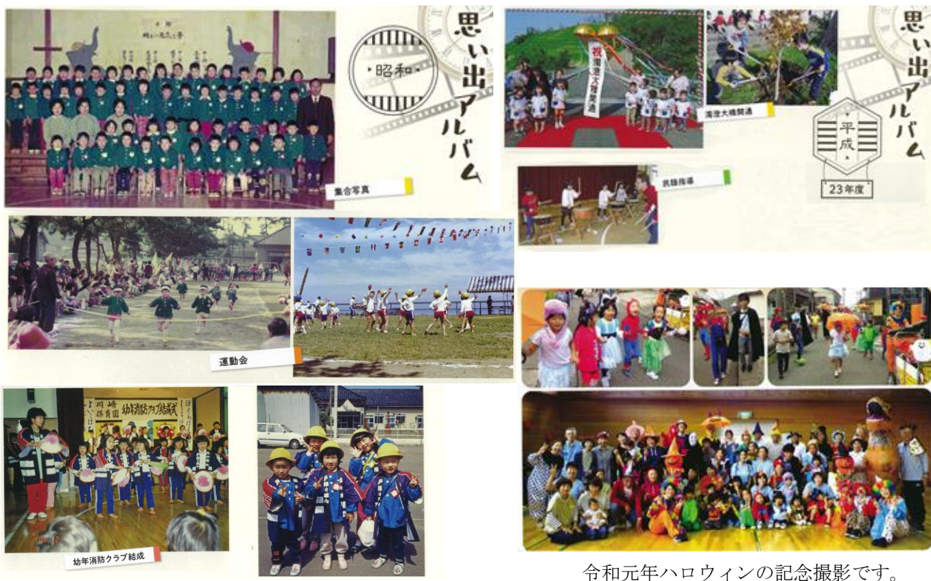
昭和から平成、そして令和へ...