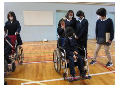
車イス補助の体験を行いました