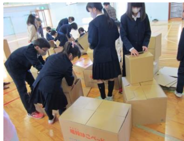
段ボールベッドを組みました