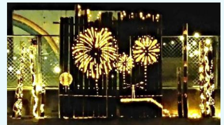
夏祭りの竹灯籠「花火」