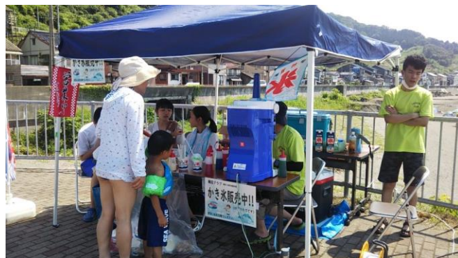
暑いなか、中学生も協力してくれました。

※今回の活動に際して、筒石漁協と筒石区からご協力いただきました。ありがとうございました。