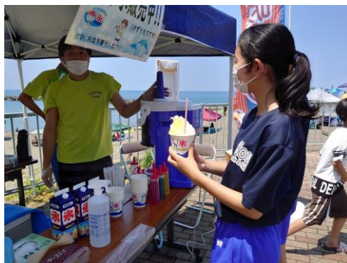
かき氷露店の様子