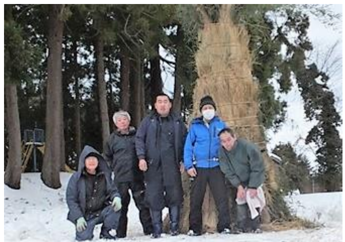
徳合地区さいの神