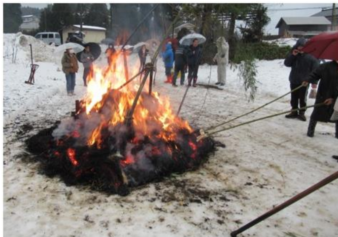
仙納地区さいの神