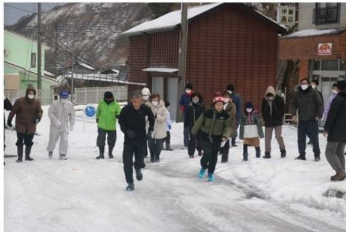
筒石元旦マラソン